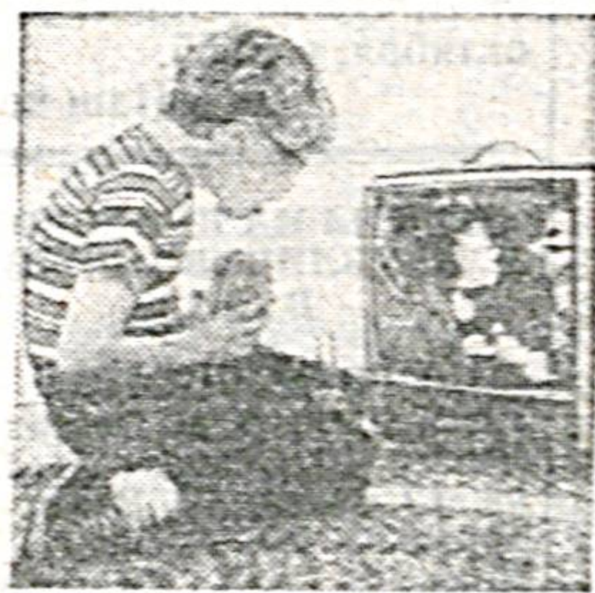
Напряжение центральной нервной системы и другие

Такие дети просто не представляют свою жизнь без ежедневного просиживания по несколько часов возле компьютерного монитора. Утомление глаз, вынужденных следить за стремительно меняющейся «картинкой» видеопрограмм, пере-