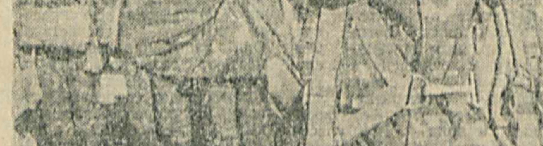
Сурата: Кичик сержант Ж. Остонов машқудот най тиза.