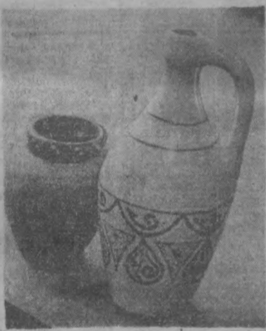
Ташкентский керамический завод начал выпускать новые кувшины.