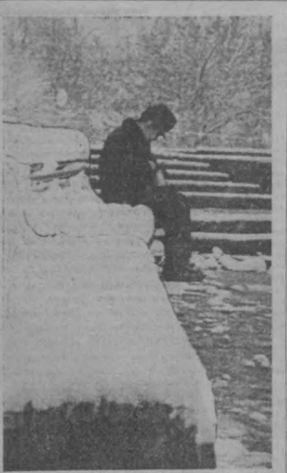
В ОЖИДАНИИ.