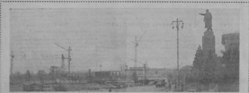
Быстрыми темпами ведется строительство семизатного административного здания на площади имени Ленина. Коллективы строительных управлений №№ 17 и 12 треста «Главташстрой» борются за то, чтобы сдать объект к 30-й годовщине Великого Октября.