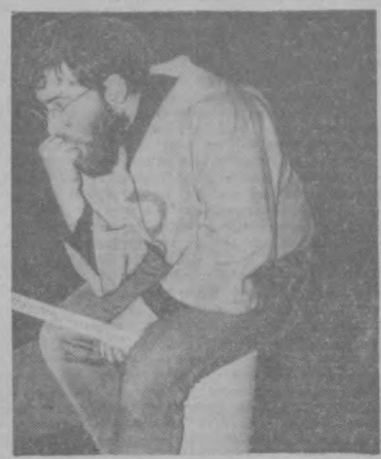
Картинки, нарисованные шимпанзе, сплюснутые под прессом автомобиля, сооружения из металлолома, «анаторморти» из консервных банок и равных бантиков — чего только нет на выставках «свободного мира». Но живой свидетель муз, сидящий на постаменте... Таного, пожалуй, еще никто не видел!

И тем не менее вот он, перед вами. Художник Йенс Йорген Торсен и несомненно его коллега «экспонируются» на выставке в столице Дании Копенгагене.