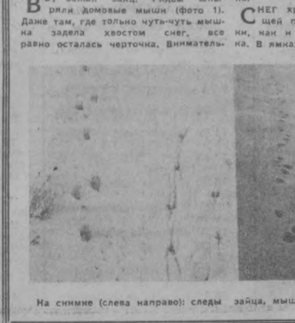
На снимке (слева направо): следы зайца, мыши, сороки, собаки, хорька.

СНЕГ хранит запись до следующей порции, до первой пометки, как и лесной до первого веточка. В ямах, там, где отпечаток чет-