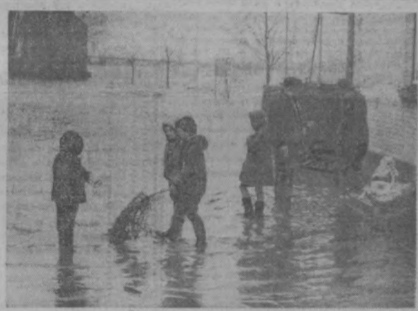
НИДЕРЛАНДЫ. В результате проливных дождей река Рейн и некоторые ее притоки вышли из берегов, вызвав наводнение в ряде провинций. НА СНИМКЕ: на улице одной из деревень в провинции Лимбург.