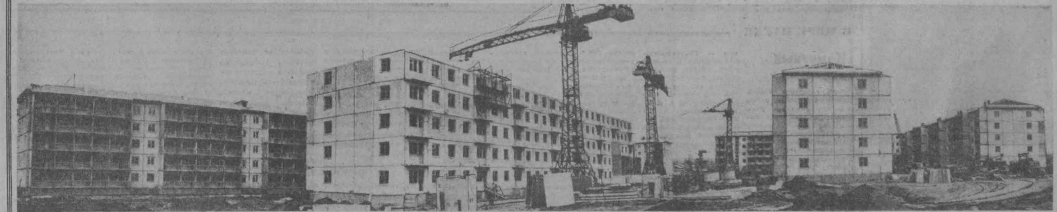
НА ОКРАИНЕ ТАШКЕНТА РАЗВЕРНУЛОСЬ СТРОИТЕЛЬСТВО КАРАКАМЫШСКОГО ЖИЛОГО МАССИВА. ЗДЕСЬ СТРОИТ ДОМА ПОСЛАНЦЫ Г. НАВОИ И АНГРЕНА.