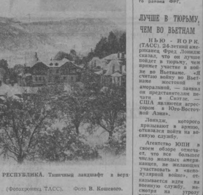
АВСТРИЙСКАЯ РЕСПУБЛИКА. Типичный ландшафт в верней Австрии.

БОНН. В центре крупнейшего промышленного района ФРГ — Рурской области — городе Вуппертале с недавнего времени базируются одна из ракетных ядерных боеголовок.