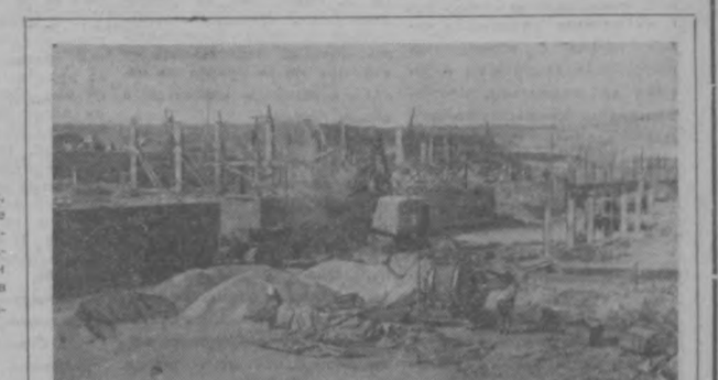
В Тунисе при содействии Советского Союза строится первый в стране национальный технический институт.

В Англии, Канаде, США созданы специальные «звонкие игрушки», ведущие пропаганду против наводнения детских магазинов автоматами, пушками, гранатами.