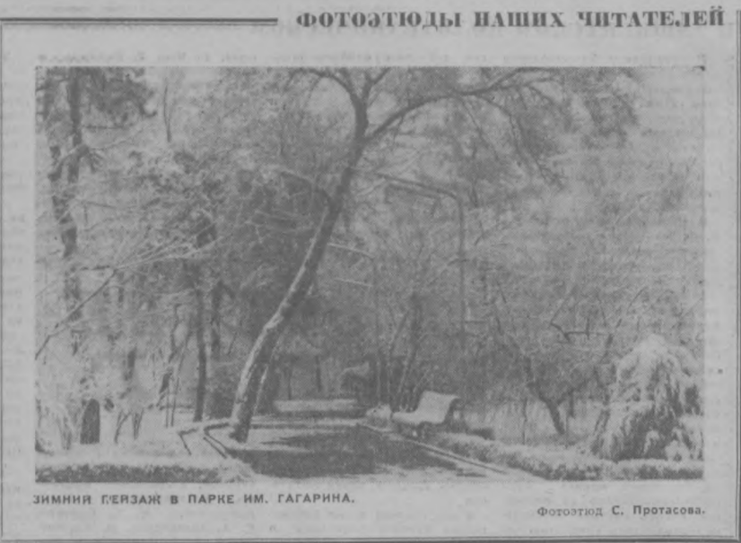
ЗИМНИЙ ПЕЙЗАЖ В ПАРКЕ ИМ. ГАГАРИНА.