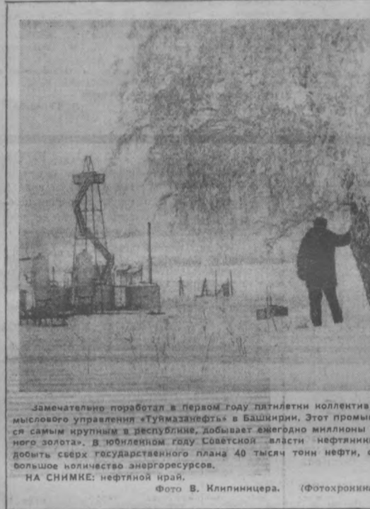
Замечательно поработал в первом году пятилетия коллектив нефтяного управления «Туймазанефть» в Башкирии.