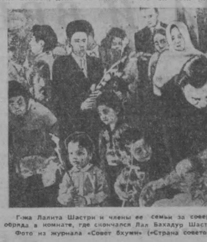
Г-жа Лалита Шастри и члены ее семьи за совершением ритуального обряда в комнате, где скончался Лал Бахадур Шастри.