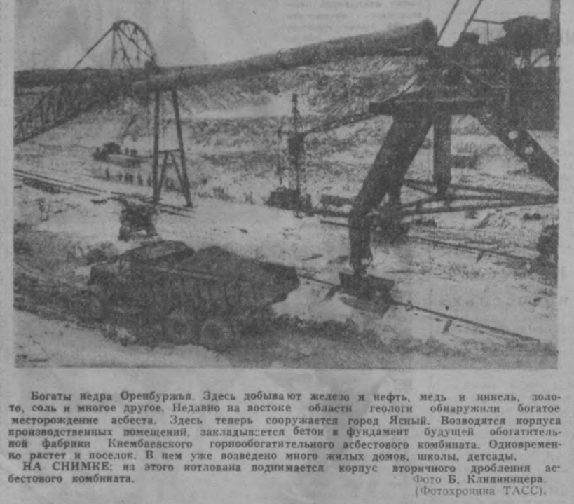
Богаты недра Оренбуржья. Здесь добывают железо и нефть, медь и никель, золото, соль и многое другое. Недавно на востоке области геологи обнаружили богатое месторождение асбеста.

Водители Туляганов, Хадидовтв приважном по автобазе казаны в администра-