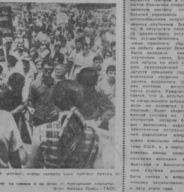
США. Жители Лос-Анжелоса собрались на митинг, чтобы заявить свой протест против агрессии во Вьетнаме. «Мир», «Нет — напалму», «Прекратить бомбежки на севере и на юге» — призывают плакаты.

НЬЮ-Йорк, 18 января. Корр. ТАСС Л. Ядронов передает: С мисса Кеннеди (штат Флорида) Соединенные Штаты произвели запуск ракеты «Титан-3» с восемью военными спутниками связи на борту. Сегодняшний запуск является третьим в попытке Пентагона создать военную систему глобальной радиосвязи с использованием искусственных спутников Земли. В результате первого аналогичного запуска, осуществленного в июне прошлого года, на орбиту вокруг Земли было выведено семь спутников связи. Второй запуск из этой серии, произведенный в августе прошлого года, окончился неудачно — ракета взорвалась через полторы минуты после старта. Предполагается, что в результате сегодняшнего запуска, если он окажется успешным, будет создана единая система из 15 спутников, которая будет выполнять задачу обеспечения непрерывной радиосвязи между всеми военными объектами США, и в первую очередь, между американскими войсками во Вьетнаме и Вашингтоне. Система должна быть готова к оперативному использованию к лету этого года.