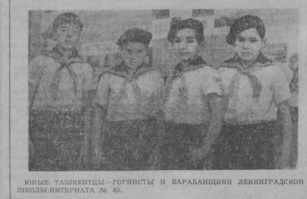
ЮНЫЕ ТАШКЕНТСЫ — ГОРНИСТЫ И БАРАБАНЩИКИ ЛЕНИНГРАДСКОЙ ШКОЛЫ-ИНТЕРНАТА № 49.

— А просились ли дети поехать с вами в Ташкент? — Просились. Они говорили: «Ну, хоть одним глазком взглянуть на Ташкент, поглядеть с лаской, с матерью — и вернуться тут же обратно». Насовсем вернуться в Ташкент никто не просился.