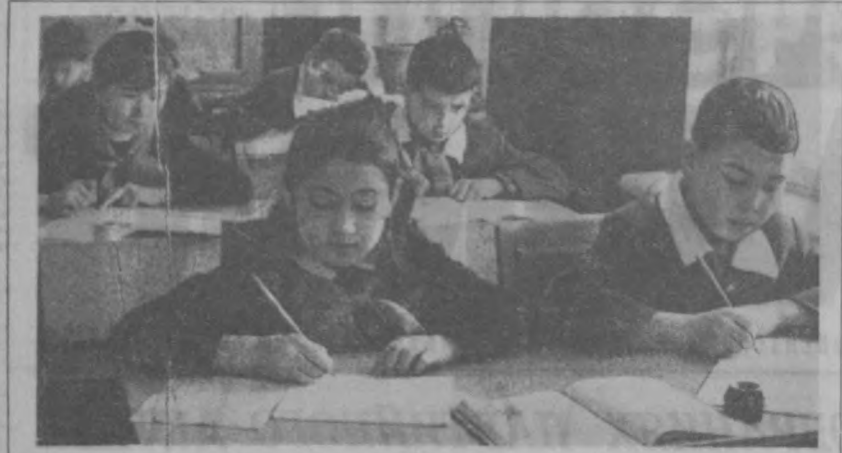
На уроке в четвертом классе московской школы-интерната № 65.