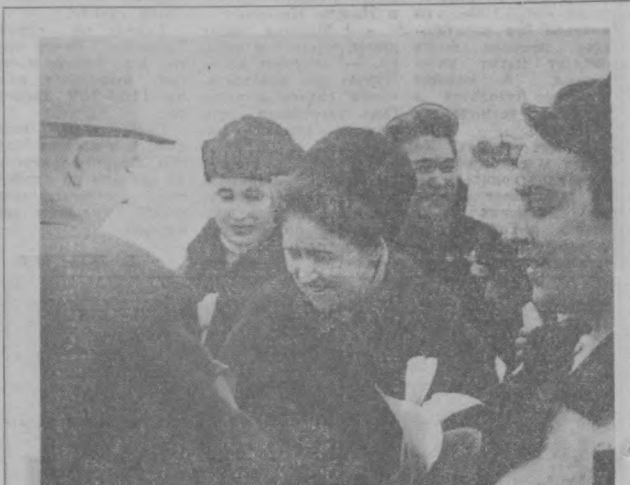
ВСТРЕЧА ДОРОГИХ ГОСТЕЙ В ТАШКЕНТСКОМ АЭРОПОРТУ.