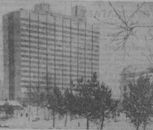
МОСКВА. В юбилейном году столица примет много гостей. Строится гостиница «Россия» на 6000 мест, «Дружба» — на 624 человека.

Музыкальные часы в сельских школах проводятся по трем программам: для начальных, средних и старших классов.