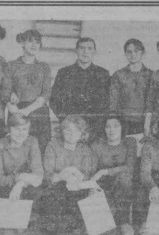
Победители получили право выступать во всевозможных соревнованиях.

Закончила свою работу II конференция Добровольного общества содействия армии, авиации и флоту Чимганского района. Перед делегатами конференции с докладом выступил председатель районного комитета оборонного Общества товарищ Кисагулов.