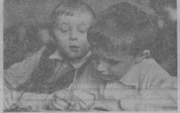
ЛЮБОПЫТНЫЙ...