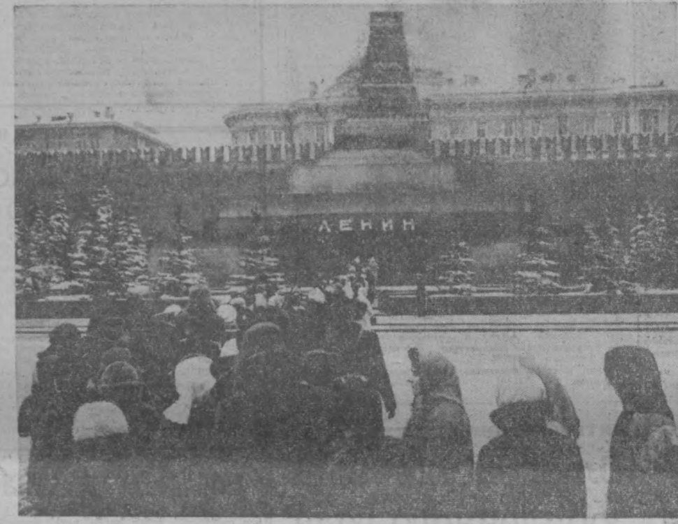
МОСКВА. ЯНВАРЬ 1967 ГОДА. КРАСНАЯ ПЛОЩАДЬ. У МАВЗОЛЕЯ В. И. ЛЕНИНА.