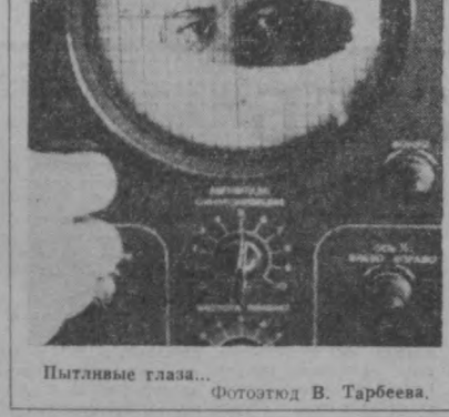
Пыльные глаза...

Радиус земли — 6 371 км. Глубина самых глубоких скважин почти в тысячу раз меньше. Штурм «подземного космоса» стоит на повестке дня. Один из проектов бурения глубоководных шахт с кавальером состоит в создании автономного скважина. Который проплавал бы перед собой породу, вдавливая ее в стенки образующейся за ним шахты. Для того, чтобы удержать лифт, который бы опускался в такую шахту, нужны приборы изл даже