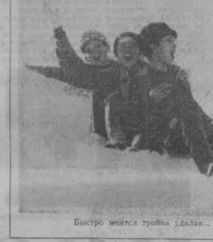
Быстро мчится тройка удаляя...

Эти блестящие, самые весомые победы Бориса Дресвянникова пришли к нему не сразу.