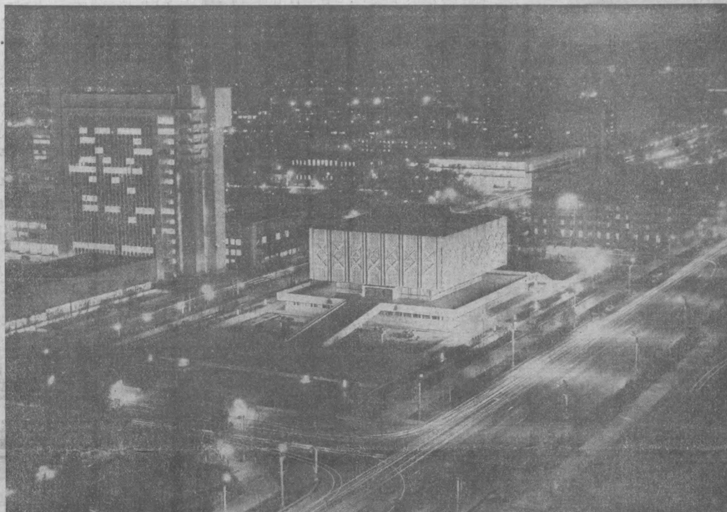
«СОЗВЕЗДИЯ» ВЕЧЕРНЕГО ГОРОДА.