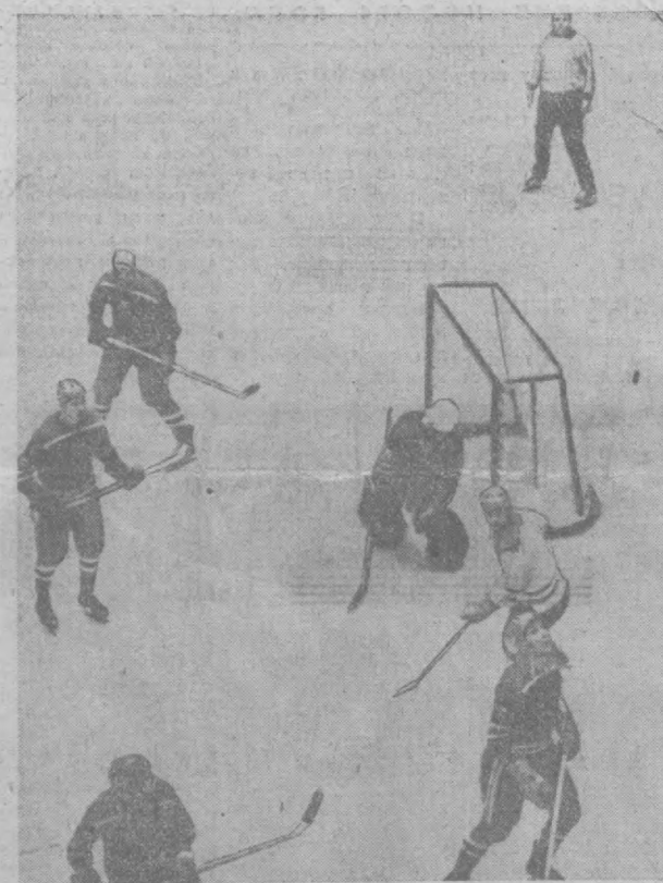
Фотохуд. И. Надеждина.