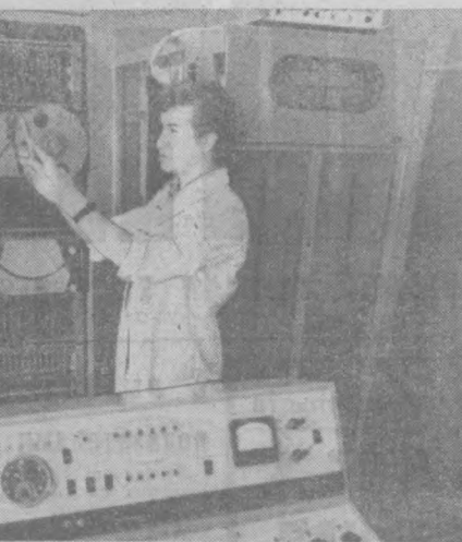
Сеismicная станция «Ташкент» — одна из старейших в стране, оснащенная современной техникой. Здесь создана автоматизированная система сбора и обработки сейсмической информации.

Сеismicологи изучают и прослушивают малейшие колебания земной коры, составляют карты сейсмических районов, которые необходимы инженерам-строителям и проектировщикам при расчетах на сейсмостойкость здания и сооружений.