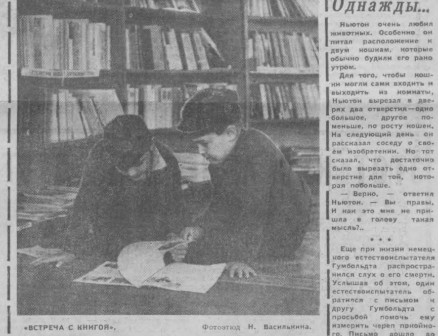
«ВСТРЕЧА С КНИГОЙ».