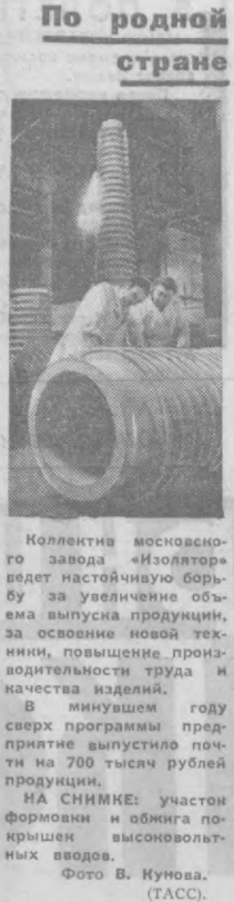
Коллектив восстановительного завода «Изолятор» ведет настойчивую борьбу за увеличение объема выпуска продукции, за освоение новой техники, повышение производительности труда и качества изделий. В минувшем году сверх программы предприятия выпустило почти на 700 тысяч рублей продукции. НА СНИМКЕ: участок формирования и обжига пористых высоковольтных выводов.