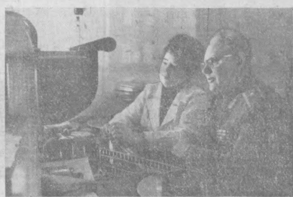
В дни подготовки и празднования 30-летия Великой Победы особенно поднимается значение государственного архива и сильно возрастает интерес к нему.

Для грядущих поколений особую ценность представляют хранящиеся в Центральном государственном архиве кинофотодокументов СССР материалы, имеющие отношение к Великой Отечественной войне 1941—1945 годов.