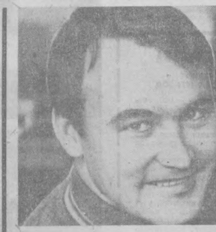
В Ташкентском горкоме КП Узбекистана