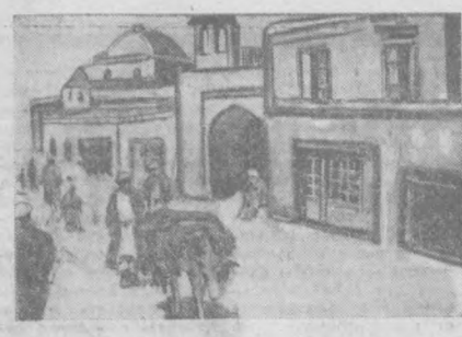
Улица Павла Неожиданностей