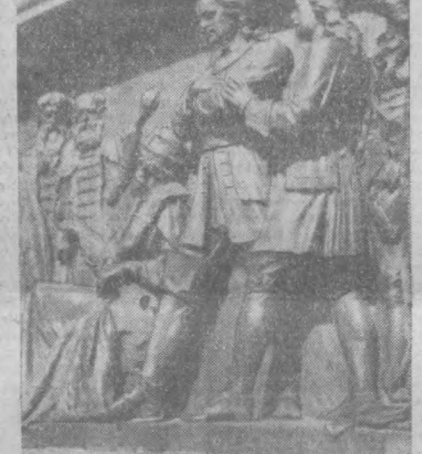
ПО ГОРОДАМ СТРАНЫ. Барельеф памятника тысячелетия России в Новгороде (фрагмент).