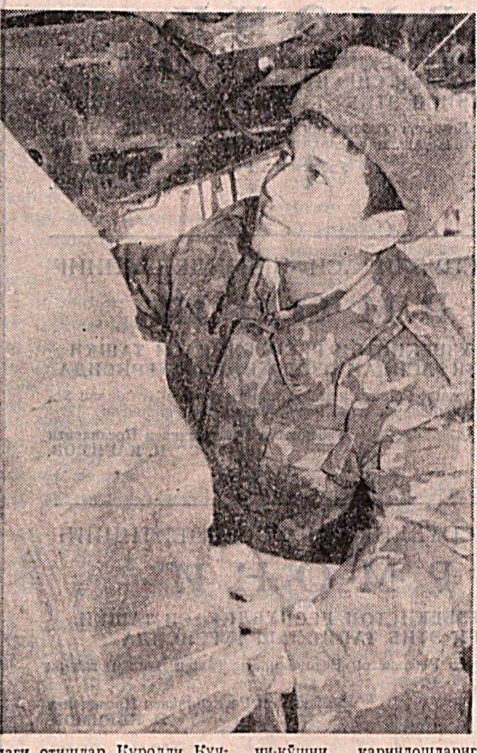
Янги отишлар Қуролли Қўчаларимиз тарихида муҳим ўрин эгаллади — омонда пайдо бўлган нишонларни зенитчилар биринчи рақатда, ҳарбий вертолётчилар ҳам илк парвозда яқсон қилдилар. Демак, омонимиз муссафоллигини таъминлаш ишончили қўлларда, дейишга тўда ҳақлимиз.