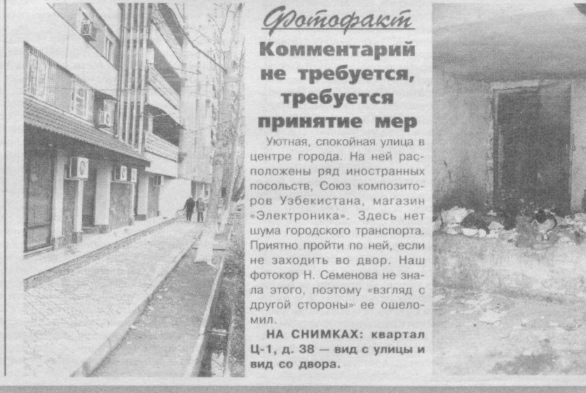
Фотодрафт Комментарий не требуется, требуется принятие мер

Вопрос о ценах установочных счетчиков уже ошелесил многократно. Стоит, вероятно, добавить, что работники агентства «Узкомунхизмат» стесуют на то, что у многих потребителей, которые покупали счетчики на базаре и устанавливали самостоятельно, эти приборы быстро выходят из строя, а гарантии на них, естественно, никто дать не может. В то время, как гарантии на приборы учета, установленные соответствующими коммунальными организациями, оговариваются в договоре на установку и эксплуатацию прибора учета на срок от 1 до 5 лет. Валерия ЕРЕМИНА.