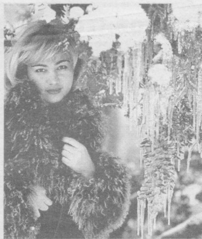
Белый, воздушный снег словно взгляд возлюбленной — прекрасен и чист.

Что нужно сделать, чтобы предотвратить опасность отравления угарным газом? Периодически вызывать специалистов для проверки и настройки всех устройств, работающих на углеродном топливе. Желтый цвет пламени газа вместо голубого свидетельствует о том, что углерод сгорает не полностью и возможно образование угарного газа.