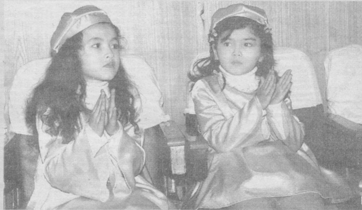
МЫ ЛЮБИМ ЧИТАТЬ СКАЗКИ И СМОТРЕТЬ СПЕКТАКЛИ.

Не влезает в книжку Косолапый мишка. Мы заменим «и» на «ы», Получилась... (вкшпч)М) Приманку сорвала И, не сказав «спасибо», Куда-то уплыла Невежливая... (Рыва) Первым просыпается пастух, Раньше пастуха встает... (хлгх)П) — Как бы мне пошла Кор-рона — Важно каркает... (вород)В) Подобрала Л. МАМИНА.