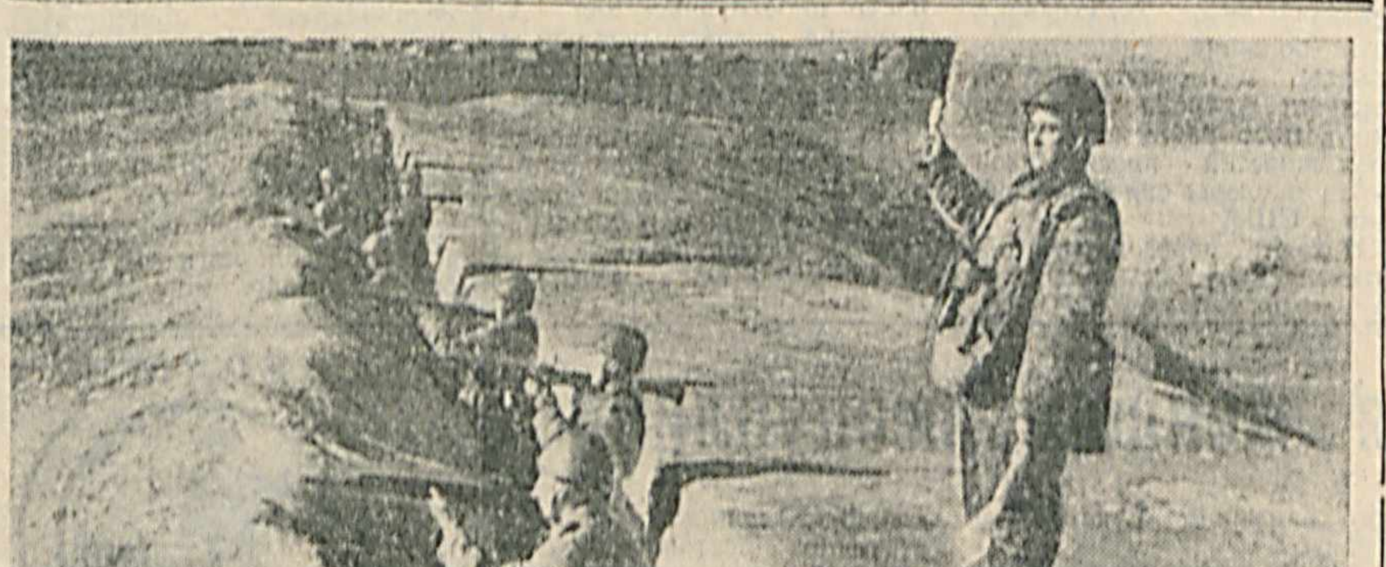
Будинидада разведкачилар гуруҳининг аҳамини бекке бўлади. Чунин, душман эҳсоси кўзлари жоғалган эришқондан ўрганиш, ўз вақтида зарур маълумотларни етказиш, зарурат тугилганда маълум кўзларини йўқ қилиш, хатто ҳарбий объектларни ишдан чиқариш ҳам уларнинг зиммасига қиради.

Ей пришлось заниматься строевой подготовкой пол 40-градусным палачим солнцем. Результат — тепловой удар и госпитализация. В итоге Шеннон решила остаться с мечтой.