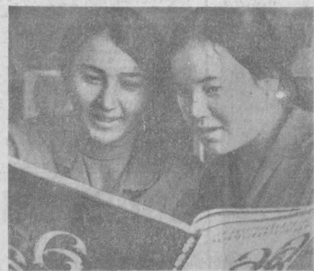
Ташкентский государственный педагогический институт имени Низами — один из крупнейших вузов республики. На его 9 факультетах занимаются 15 тысяч студентов. Ежегодно его заканчивают 2,500 человек.