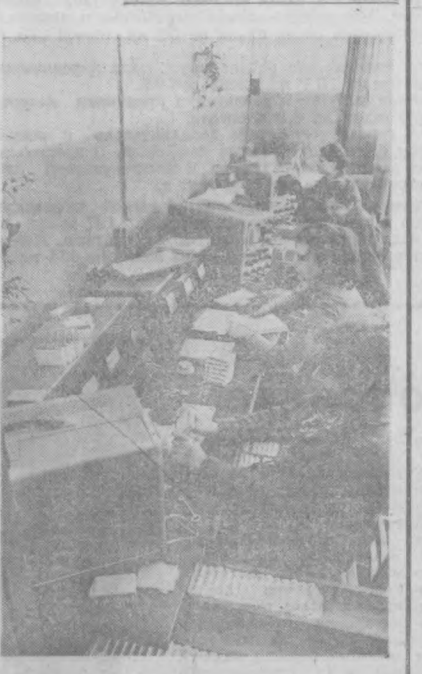
Есть в городе Калинин завод электроаппаратуры. Его основная продукция — логические элементы. Это небольшая коробочка из пластмассы, начиненная радиодетальями.

Калининские «логиксы» экспортируются в 50 стран мира. Сейчас, в частности, выполняются заказы металлургов Индии.