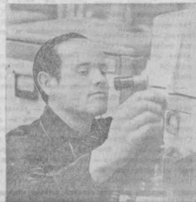
Институт геологии и геофизики АН УССР имени Х. М. Абдуллаева. Здесь начала работать новая лаборатория — физическая методов исследований.

Опытная партия бор-суперфосфата была получена на Сумгаитском суперфосфатном заводе и успешно прошла испытания на полях республики.