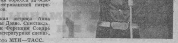
Имя Анджелы Дэвис на устах у прогрессивных людей всего мира. Они борются за освобождение мужественной американской патриотки из тюремных застенков. НА СНИМКЕ: венгерская актриса Анна Черхальми в роли Анджелы Дэвис. Спектакль, посвященный ей, поставлен Ференцем Сандэре в будапештском театре «Интерартус сцена».