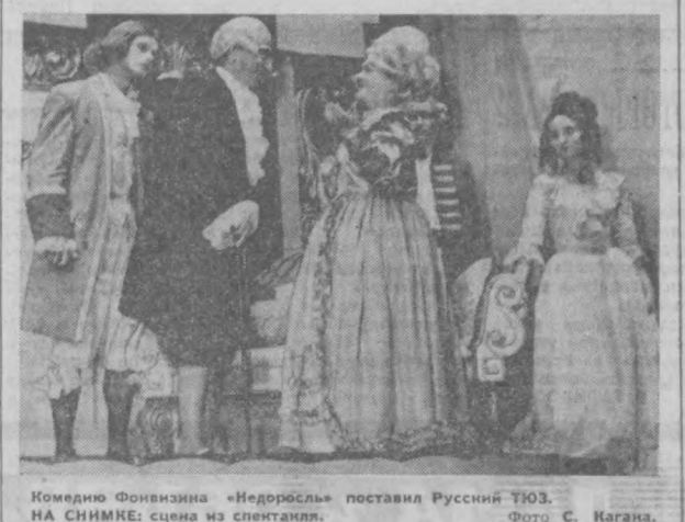
Комедия Фонзизина «Недоросль» постановка Русский ТЮЗ. НА СНИМКЕ: сцена из спектакля.

«...На борту автоматической межпланетной станции «Марс-3» установлена аппаратура для изучения структуры радионалучения Солнца в метровом диапазоне волн».