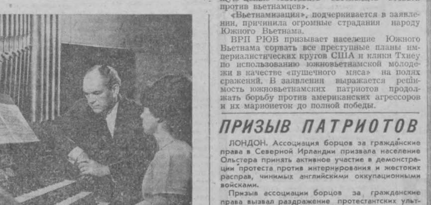
На СНИМКЕ: органы из Крнова установлены в Пражской Академии музыкальных искусств, высшем музыкальном учебном заведении республики.

СССР. Небольшой город Крнова, что в Северной Моравии, называют «колыбелью чехословацких органов».