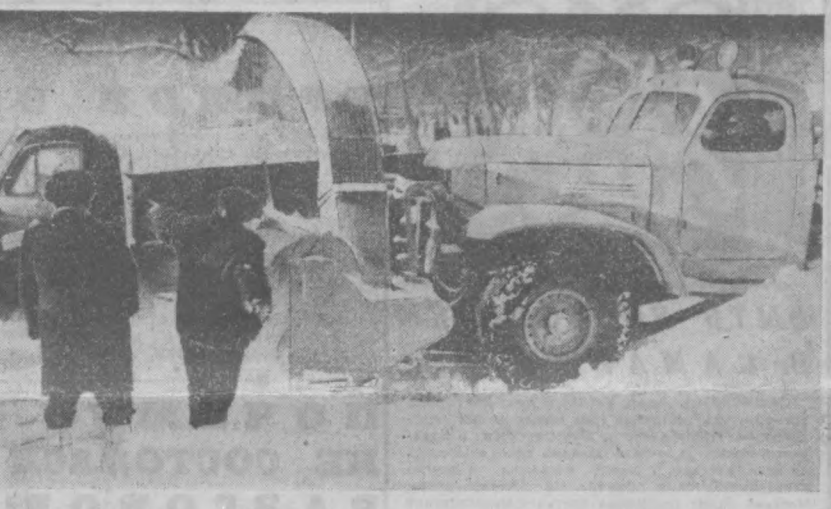
НА ГОРОДСКИЕ ТЕМЫ

Недавно в институте «Гипрорыбпром» закончили проектирование двух котильных цехов, которые будут построены в Узбекистане.