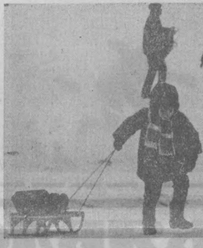
Силуэты зимы.

Грозовые разряды позволяют судить не только о состоянии атмосферы, но и строения земных недр. Советские геологи установили, что, наблюдая за вспышками молний с помощью специальной аппаратуры, можно выявить рудные залежи.