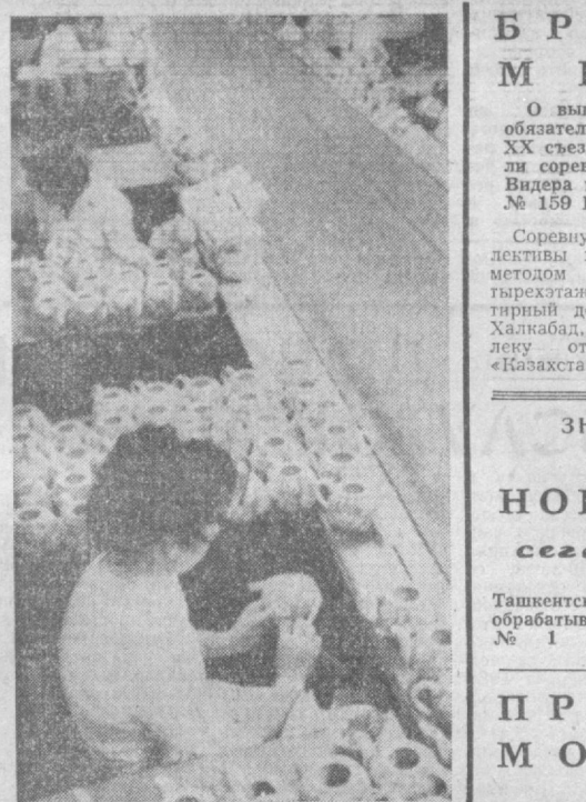
ТАШКЕНТСКИЙ ФАРФОРОВЫЙ ЗАВОД. Более чем 29,2 миллиона штук изделий фарфоро-фаянсовой посуды выдал в прошлом году коллектив предприятия. В этом году объем производства вновь возрастет. Особое значение специалисты завода придают качеству, отделке, улучшению товарного вида изделий.

НА СНИМКЕ: в живописном цехе предприятия идет окончательная отделка продукции.