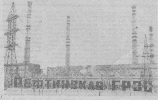
МОЩНОСТЬ УВЕЛИЧИВАЕТСЯ. СВЕРДЛОВСКАЯ ОБЛАСТЬ. Досрочно освоить последний, десятый энергоблок обласдал коллектив Рефтинской ГРЭС. С его пуском мощность станции достигла 3,8 миллиона киловатт. На предприятии намечены мероприятия, повышающие надежность оборудования, продолжа-