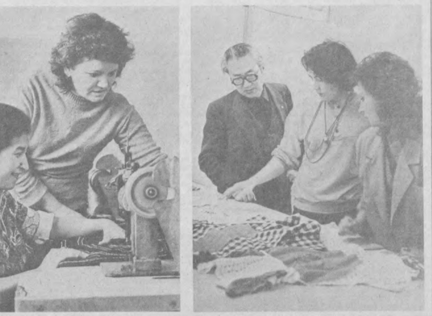
проведена большая: убраны лишние звенья управления, укреплены творческие подразделения. Была поставлена задача при одновременном повышении качества выпускаемой продукции снижать ее себестоимость за счет рациональной организации труда, использования сырья и материалов. И задача эта достигнута.

По общему мнению, подготовка к переходу на работу в условиях хозрасчета и самофинансирования многое дала коллективу. Научила главному: вести дело по-хозяйски, считать расходы и доходы. Жить по средствам, помнить, что никто за тебя не будет делать твою работу, если ты сам не хочешь ее заниматься. Поэтому работа в период подготовки была