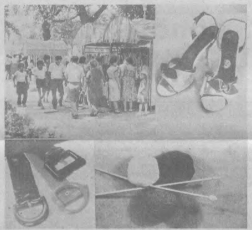
Чимкентское облторгуправление. Узбекское рекламное производственное предприятие ВПО «Союзреклама» (телефон 45-37-24).