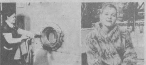
Ташкентская фабрика «Химчистка».