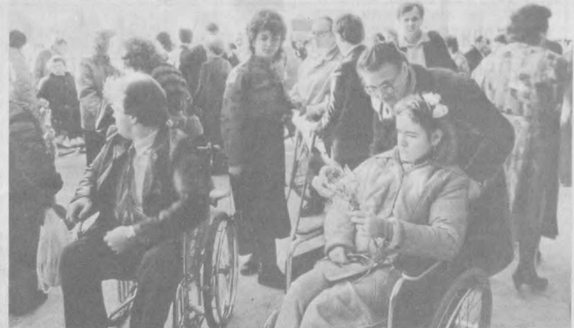
Благотворительный вечер для членов Московского общества инвалидов прошел в театре «Сатрикон», где был показан спектакль. По инициативе Советского фонда милосердия и здоровья в Союзе театральные деятели в гостях у актеров побывали инвалиды. Это первая акция милосердия театра, предоставившего