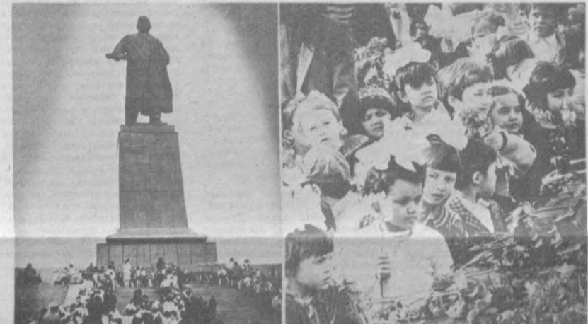
Площадь В. И. Ленина сегодня. Цветы — к памятнику вождю революционного пролетариата.

В тот же день участники торжества по случаю 119-й годовщины со дня рождения В. И. Ленина возложили цветы к памятнику вождю пролетарской революции.