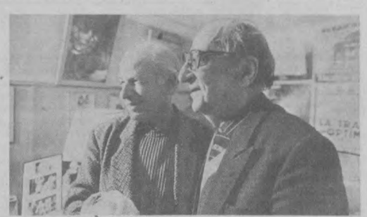
Выдающийся английский режиссер Питер Брук посетил Академический большой драматический театр имени М. Горького накануне гастроль «Бруклинской академии музыки», которая покажет пьесу А. Чехова «Вишневый сад» в постановке П. Брука.

НА СНИМКЕ: Питер Брук (слева) и главный режиссер театра Георгий Товстоногов во время встречи.