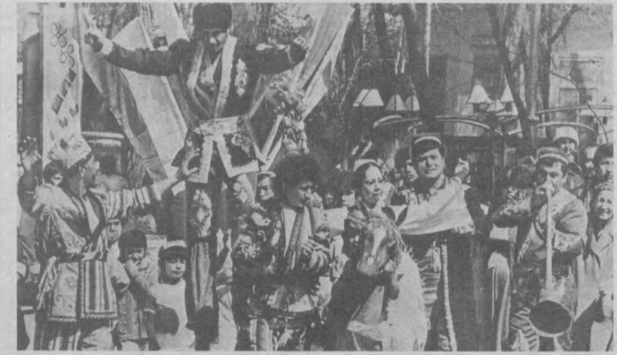
В Ташкент пришел праздник.