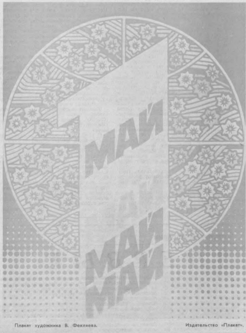
Плакат художника В. Феялева.

ДА ЗДРАВСТВУЕТ 1 МАЯ — ДЕНЬ МЕЖДУНАРОДНОЙ СОЛИДАРНОСТИ ТРУДЯЩИХСЯ