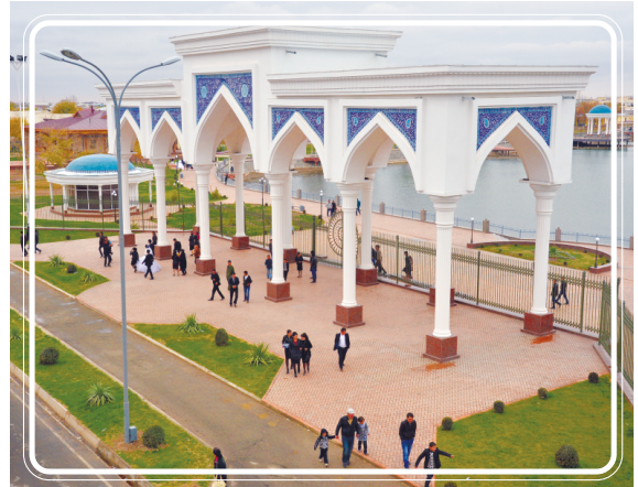
Сотим АВАЗ, шоир.

14,2 километр масофада, салкам 90 гектар майдонда аҳоли дам олиш масканлари барпо этилиб, ободонлаштириш ишлари бажарилди.