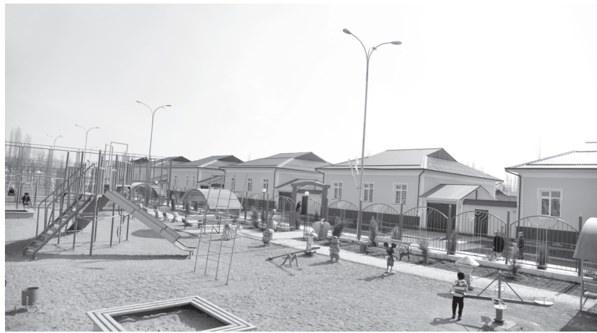
(Давоми. Бошланиши 1-бетда).

шиори остида юртимизда саломатлик ҳафталиги ўтказилмоқда