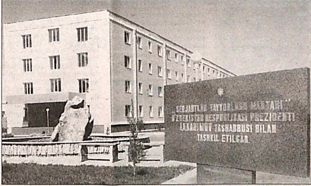
Президентимизнинг, давлатимизнинг доимий эътиборида эканлигини кўрсатди. Хизмат сафарим давомида мен мазкур ўқув масканида кейинги пайтларда яратилган шарт-шароитлар, бунёдкорлик ишлари билан танишдим...