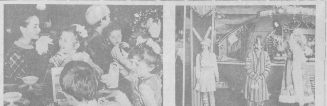
НА СНИМКАХ: в кафе «Космосдром» на встречу с Дедом Морозом пришли дети, и взрослые.