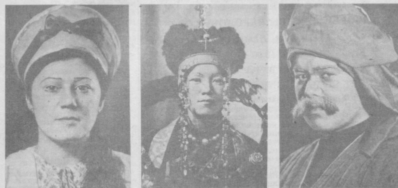
Люди редкой профессии