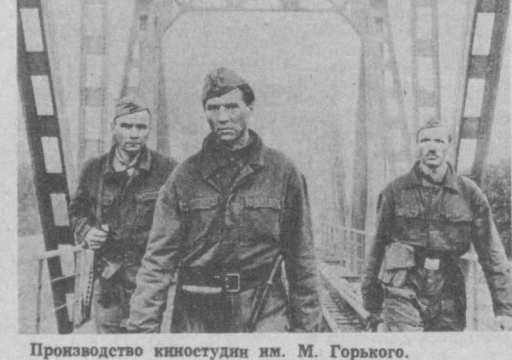
Производство киностудии им. М. Горького.

Автор сценария — А. Беляев. Режиссер — Г. Иванов. В ролях: Е. Меньшов, П. Глебов, Ю. Горобин и другие. Остроумный фильм о войне, о подвиге двенадцати воинов-десантников, сумевших захватить и разминировать важный стратегический объект в тылу врага.