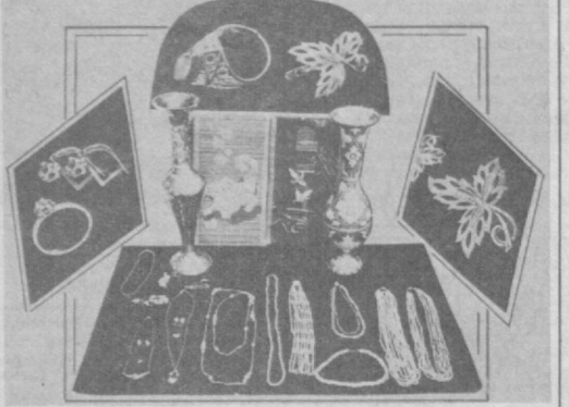
Республиканское оптово-розничное объединение «Алмаз» (телефон 33-17-04).

Адрес магазина: г. Ташкент, проспект Ленина, 77 (метро — станция «Проспект Космонавтов»).