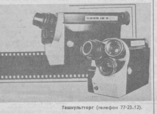
Ташкультторг (телефон 77-23-12).

Частота съемки — 16, 24, 32 кадра в секунду и показываемая. Цена — 540 руб.