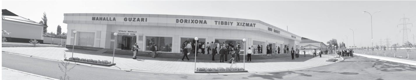
(Давоми. Бошланиши 1-бетда).

Долзарб мавзуда ташкил этилган конференция озиқ-овқат саноатидаги ҳамкорлигимизни янги bosqichga кўтаришга, юртингиздан ишончли ҳамкорлар топшишимизга хизмат қилиши билан жуда ахамиятлидир.