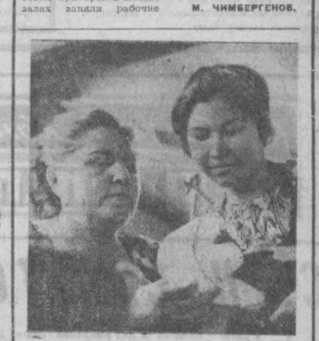
ТАШКЕНТСКАЯ ОБЛАСТЬ. Выпустили 22 тысячи пар сверхплановой обуви решил в этом году совхоз имени Лигинойской обувной фабрики...

Колхоз финансирует сервис. ТУРТУКУЛЬ. Первые посетители пришли недавно в бытовомбинат на центральной усадьбе колхоза имени Димитрова Туртукльского района.