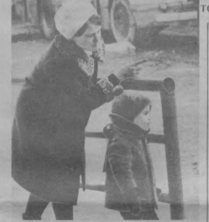
ТВОРЧЕСТВО НАШИХ ЧИТАТЕЛЕЙ