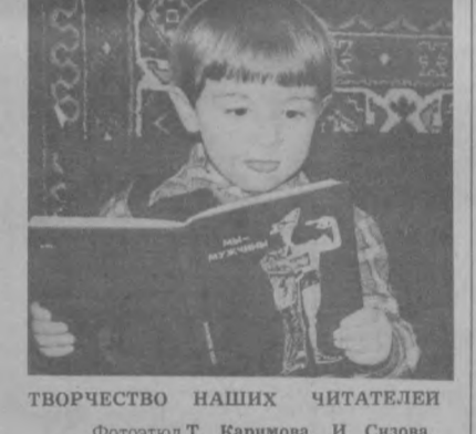
ФОТОТЮД Т. КАРИМОВА, И. СИЗОВА.