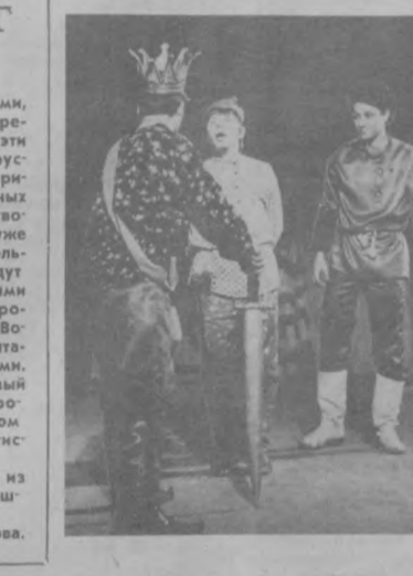
НА СНИМКЕ: сцена из спектакля «Скоморошный царь»