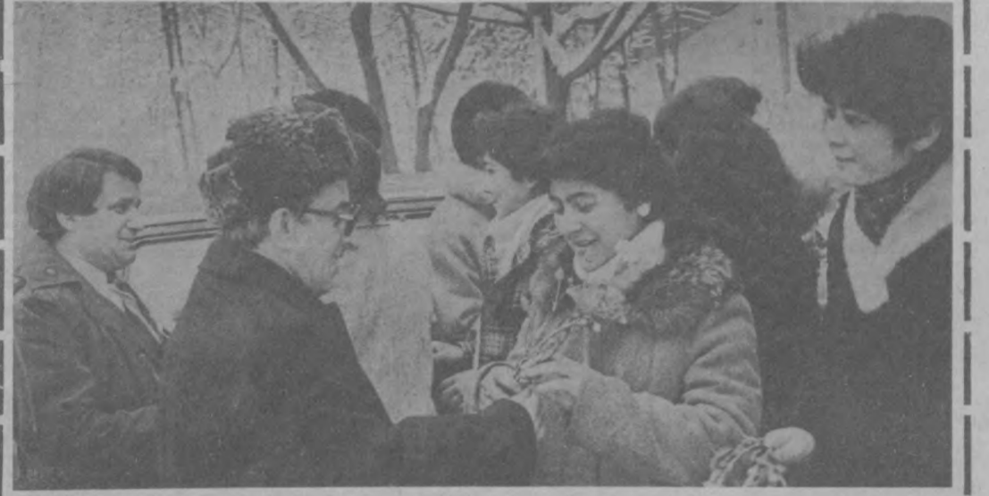
Узами теплой дружбы связаны Ташкентский государственный университет имени В. И. Ленина и Скопленский университет имени Кириллы и Мефодия. Как вчера в стенах ташкентского вуза посланцы из Македонии, ее столицы Скопле.