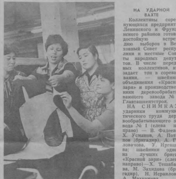
НА УДАРНОЙ ВАХТЕ

Коллективы соревнующихся предприятий Ленинского и Фрунзенского районов готовятся к встрече с делегацией в Верховный Совет республики и местные Советы народных депутатов. В числе передовых коллективов, кто задает тон в соревновании, — швейники объединения «Красная заря» и производственный деревообрабатывающий завод № 1 Главышестрой.