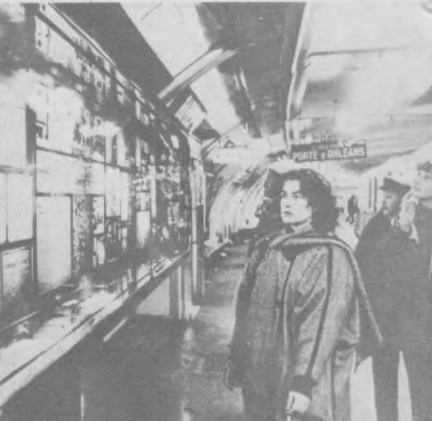
Ее экспонаты рассказывают о жизни легендарного партизана, героя Сопротивления полковника Фабьена. Именно здесь, на этой станции метро, в 1941 году он выстрелил из револьвера уби немецкого офицера. Его отважный поступок послужил примером для многих французских патриотов, взявшихся за оружие для борьбы с оккупантами.