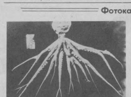
Пожалуй, самой большой достопримечательностью аквариума в японском городе Тока (префектура Миэ) стал этот мальш-деревянный, пойманный в конце прошлого года древним рыбаком в заливе Исе. Само название «осминог» подразумевает, что у этого обитателя морского дна должно быть восемь ног, а у носовала аквариума их целых 25! Однако у посетителя аквариума возникает симпатия и малышу не только из-за его необычного природного «дарования», но и потому, что он отличается «веселым нравом» и «общительным характером».