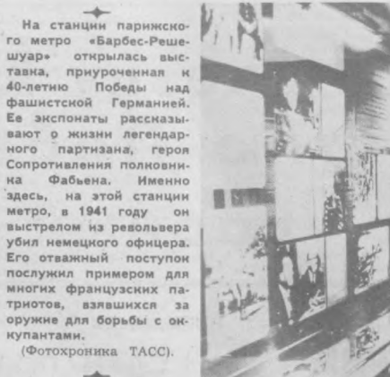
На станции парижского метро «Барбес-Решешуар» открылась выставка, приуроченная к 40-летию Победы над фашистской Германией.

Совместный научный потенциал двух братских стран используется также для выведения новых сортов картофеля, которые бы не только имели хорошие вкусовые качества клубней, но и могли быть пригодными для длительного хранения, устойчивыми к различным болезням. Один из таких сортов, получивший название «добр», проходит сейчас государственные испытания.