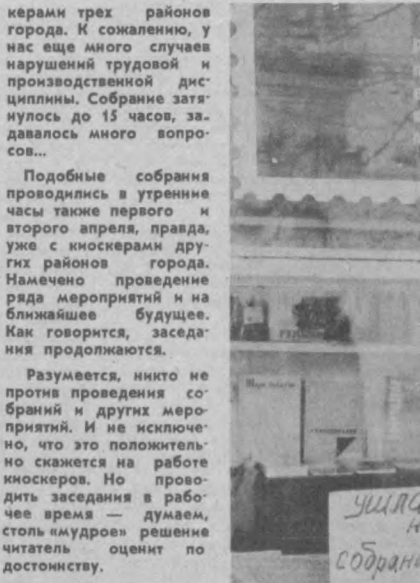
Ушла на собрание

ПОГОДА В 11 часов утра в Ташкенте было 22 градуса тепла. В ближайшие сутки температура ночью 12—14°, днем — 18—20° тепла.