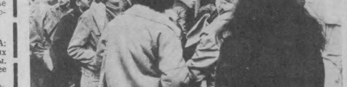
Экономические и социальные проблемы, с которыми сталкивается сегодня Франция, приобретают все более серьезный характер.

Экономические и социальные проблемы, с которыми сталкивается сегодня Франция, приобретают все более серьезный характер. Число безработных достигло за последние годы небывалой цифры — 2,5 миллиона человек.