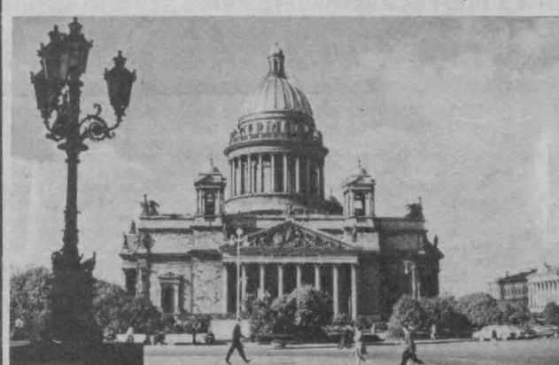
Исакиевский собор — один из самых значительных памятников зодчества города.

Недалеко от Невы, в центре Ленинграда, находится величественный памятник архитектуры — Исакиевский собор — один из самых значительных памятников зодчества города.