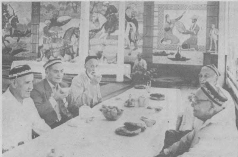
НА СНИМКЕ: В чайхана почетных стариков.