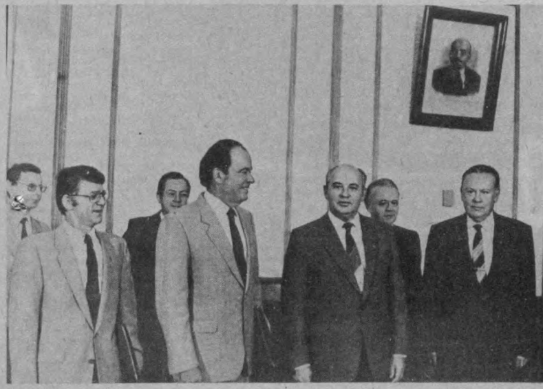
НА СНИМКЕ: во время встречи.

2 сентября состоялась встреча Генерального секретаря ЦК КПСС М. С. Горбачева с Генеральным секретарем Французской компартии Ж. Марше.