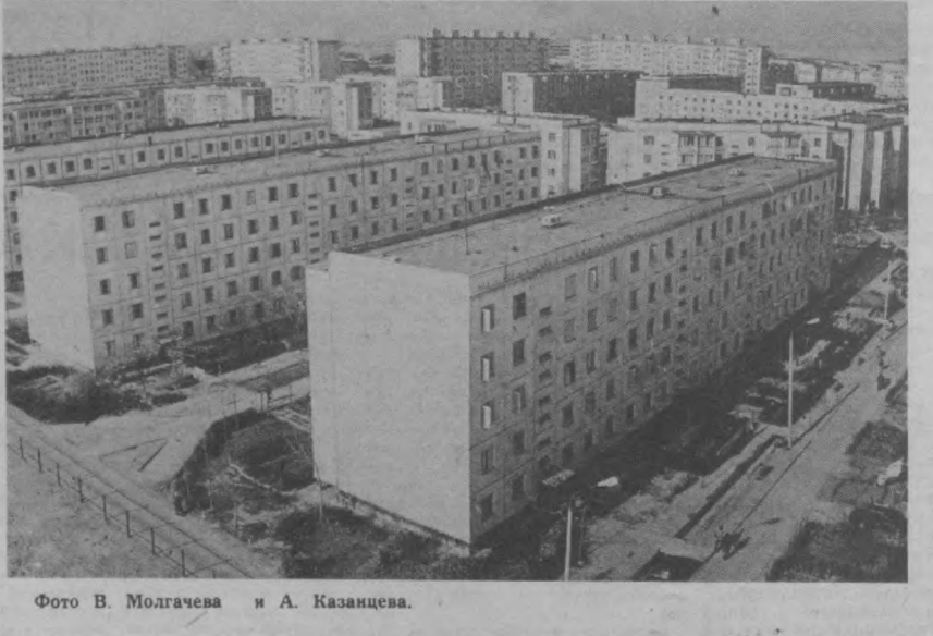
НА СНИМКАХ: Ташкент сегодня.